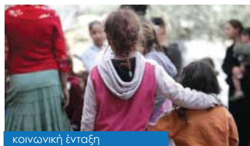
κοινωνική ένταξη & στήριξη ευπαθών ομάδων