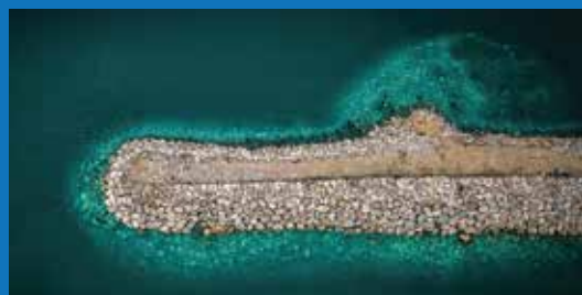
ΑΝΤΙΜΕΤΩΠΙΣΗ ΔΙΑΒΡΩΣΗΣ ΑΚΤΩΝ