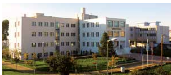
ΝΕΟ ΔΗΜΑΡΧΕΙΟ ΚΑΛΑΜΑΤΑΣ

ενιαία στέγαση υπηρεσιών και μείωση κόστους