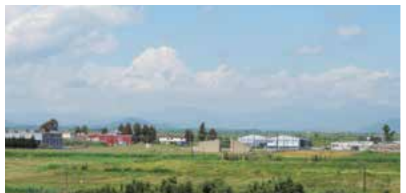
εκσυγχρονισμός βιομηχανικών περιοχών

υποστηρικτικά έργα και δράσεις για μια σύγχρονη γεωργία και κτηνοτροφία