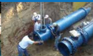
ΕΚΣΥΓΧΡΟΝΙΣΜΟΣ ΔΙΚΤΥΩΝ ΥΔΡΕΥΣΗΣ