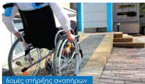
δομές στήριξης αναπήρων και υπερηλίκων