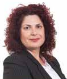
Χειλά - Μπόσινα Έφφ