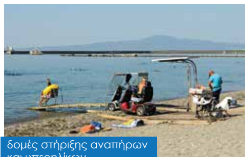
δομές στήριξης αναπήρων και υπερηλίκων