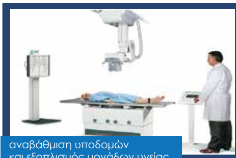
αναβάθμιση υποδομών και εξοπλισμός μονάδων υγείας