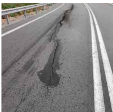
ΑΓ. ΦΩΚΑΣ - ΝΕΑΠΟΛΗ

χωρίς σύγχρονο και ασφαλές οδικό δίκτυο δεν μπορεί να υπάρξει ανάπτυξη