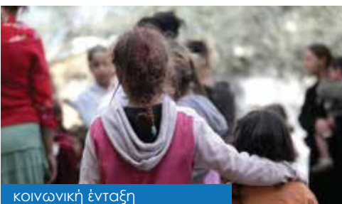
κοινωνική ένταξη & στήριξη ευπαθών ομάδων