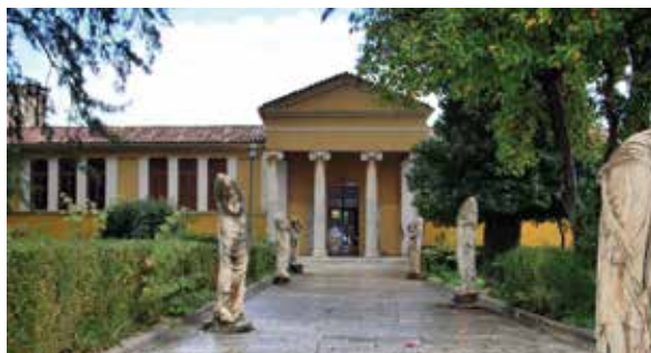
ΑΡΧΑΙΟΛΟΓΙΚΟ ΜΟΥΣΕΙΟ ΣΠΑΡΤΗΣ