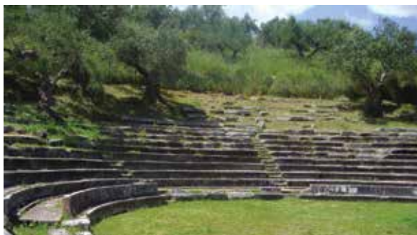
ΑΡΧΑΙΟ ΘΕΑΤΡΟ ΓΥΘΕΙΟΥ