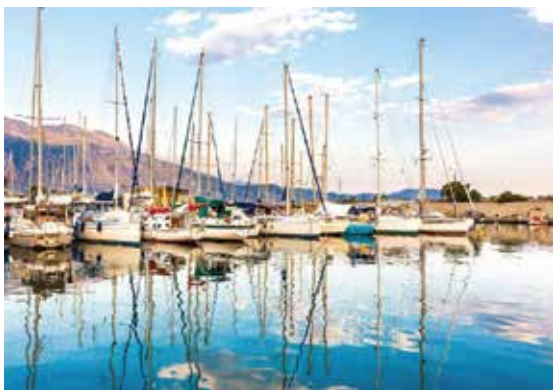
θαλάσσιος τουρισμός - μαρίνα