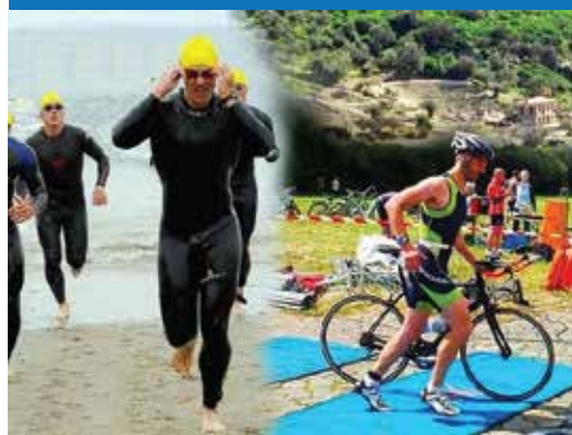
διεθνής εκδήλωση Epidavros Action