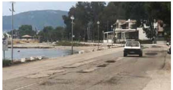
παραλιακή οδός Ναύπλιο - Μύλοι