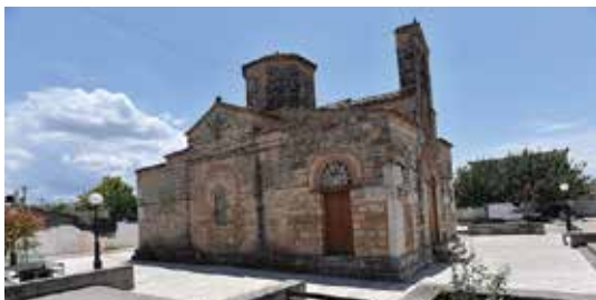
ΝΑΟΣ ΚΟΙΜΗΣΕΩΣ ΘΕΟΤΟΚΟΥ-ΝΕΟ ΗΡΑΙΟ