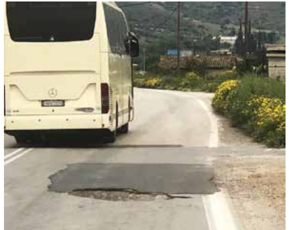
εθνική οδός Άργος - Τρίπολη