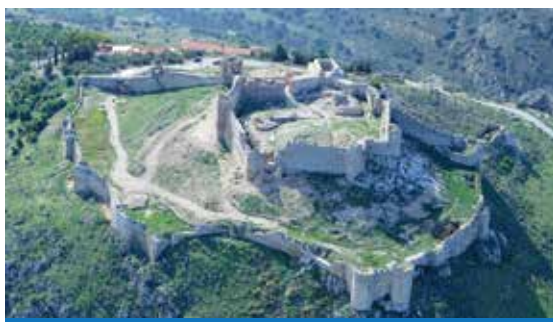
κάστρο Λάρισα - Άργος