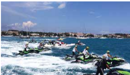
πανελλήνιο πρωτάθλημα τζετ σκι