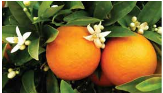
στήριξη εισοδήματος αγροτών