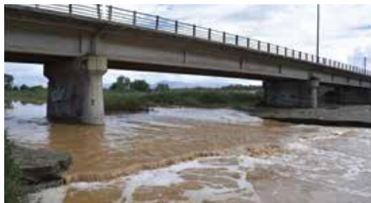
εκμετάλλευση του υδροφόρου ορίζοντα