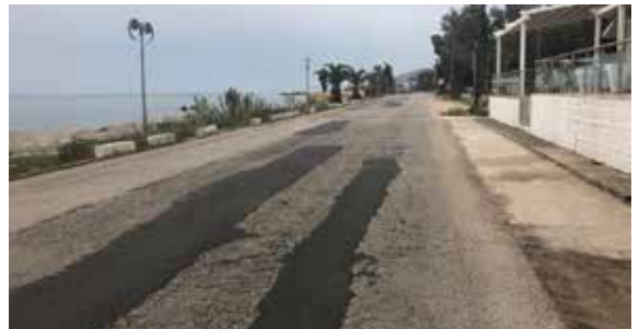
παραλιακή οδός Ναύπλιο - Μύλοι